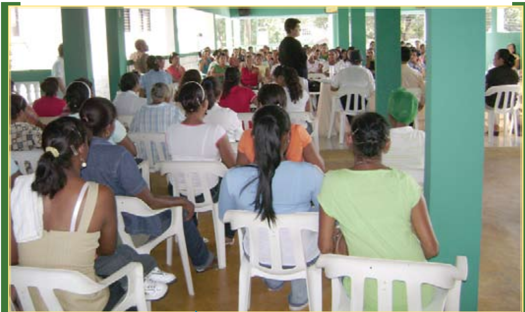
Vista parcial de las asistentes en la Asamblea de Presupuesto Participativo.