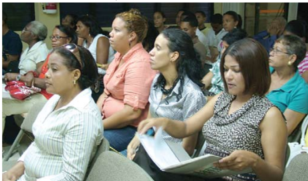
Vista parcial de asistentes al evento.

La realización de este Seminario es una iniciativa que ejecuta la Fundación Solidaridad y un grupo de Organizaciones Asociadas (Consejo de Desarrollo Estratégico de Santiago, Consejo de Desarrollo Estratégico de Villa González y la Asociación Municipal de Mujeres de Villa González en el marco del proyecto Participación e Incidencia de la Sociedad Civil en la Gestión Municipal iniciativa financiado por la Unión Europea – a través del Fondo Europeo de Desarrollo de la Sociedad Civil (FONDESIN) y el Programa de Apoyo a las Iniciativas Locales de la Sociedad Civil (PRIL).