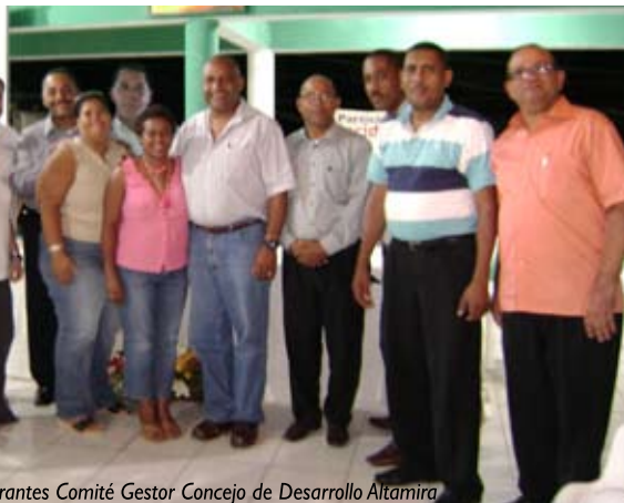
Integrantes Comité Gestor Concejo de Desarrollo Altamira

que comprende un periodo que va desde el 2009 y hasta el año 2014.