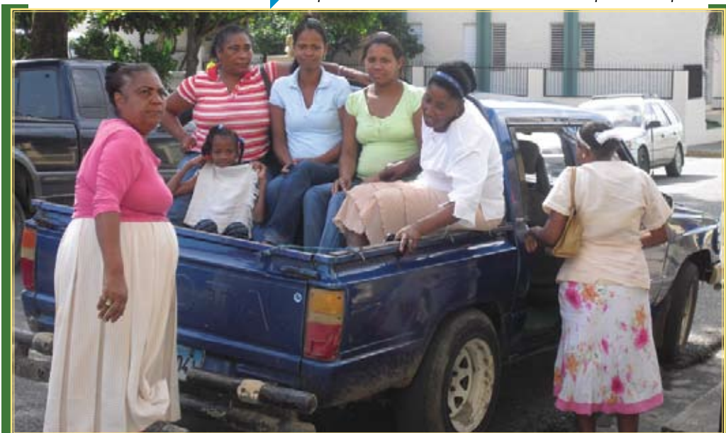
Mujeres llegando de las comunidades más alejadas de Altamira.